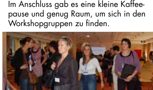
Im Anschluss gab es eine kleine Kaffeepause und genug Raum, um sich in den Workshopgruppen zu finden.