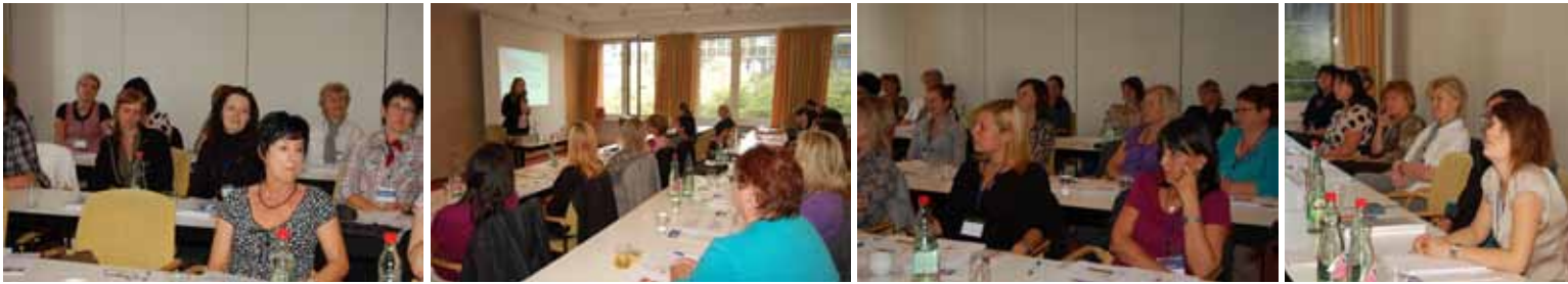
Workshop 8 mit F. Hasse im Seminarraum Machiavelli: Besser lesen